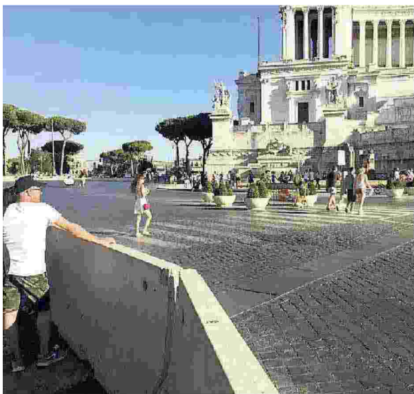
Jersey e fioriere tra piazza Venezia e i Fori Imperiali, Roma

Anche a Milano sono state posizionate delle nuove bar-